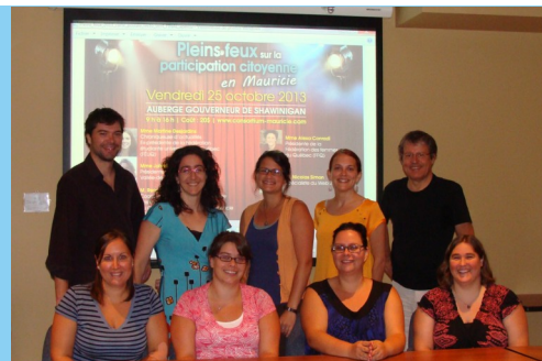
Le comité de développement citoyen

- Révision du mandat comme suit : mettre en lumière la participation citoyenne régionale;