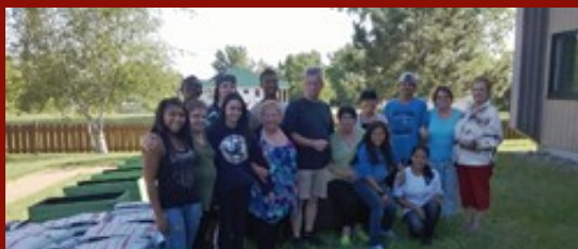
Alpha-francisation des familles immigrantes en HLM. Il s'agit d'un des 13 projets appuyés dans le cadre du FQIS à Trois-Rivières.

- Appui à la soumission de 13 projets sur le territoire de Trois-Rivières qui se sont vu accordé un financement dans le cadre du FQIS;