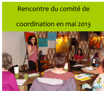
Rencontre du comité de coordination en mai 2013

- Révision du plan d'action concerté 2010-2013 , proposition d'un plan d'action 2012-2014 et révision de la mission et de la vision du Consortium par le comité de coordination.