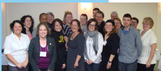
Des participants à la formation ayant eu lieu à La Tuque

Le Consortium, en collaboration avec l'ASSS Mauricie/Centre-du-Québec, a servi de courroie de transmission pour former bon nombre de partenaires à utiliser les outils pour apprécier le potentiel de développement des communautés. Créés par Réal Boisvert de l'ASSS-MCQ, ces outils ont été regroupés dans la trousse « Ma communauté, clé en main » .