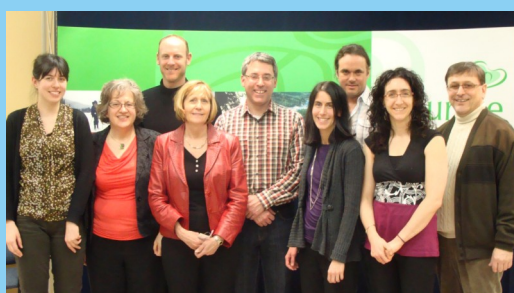
Le comité en habitation

-États des lieux sur la tournée du portrait qui s'est déroulée en 2011 et mise à jour des actions pour les 6 territoires qui résultaient également du Portrait de l'habitation en Mauricie;