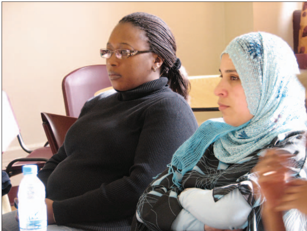
Des participantes à un atelier sur le logement dans le quartier Ahuntsic-Cartierville, à Montréal.