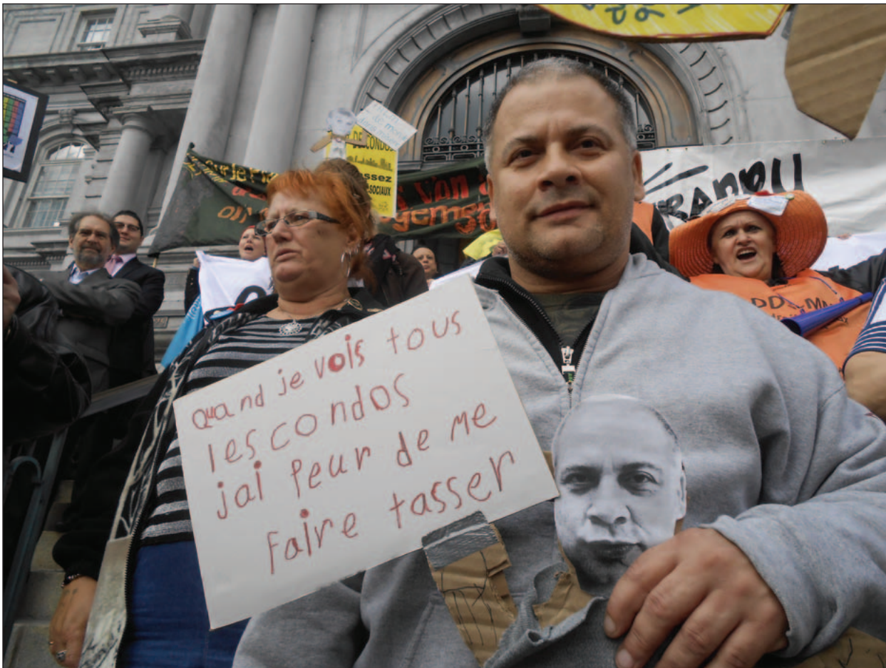
Lors d'une manifestation à l'hôtel de ville de Montréal. Photo: Samuel Saint-Denis Lisée.

location 4 . C'est 30% de plus qu'en 2010.