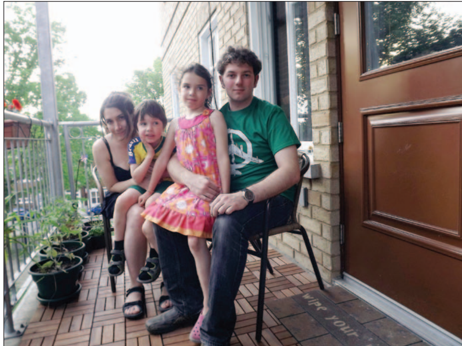
Une famille qui a amélioré ses conditions de logement à la coopérative d'habitation L'Escalier, à Québec.

Le logement social représente la meilleure façon d'assurer la mise en œuvre du droit au logement, puisqu'il est sans but lucratif, à propriété collective et qu'il est subventionné directement par les gouvernements.