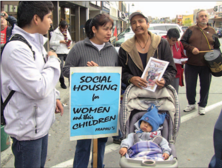
Une famille autochtone participe à une manifestation du FRAPRU, à Val-d'Or, en Abitibi.