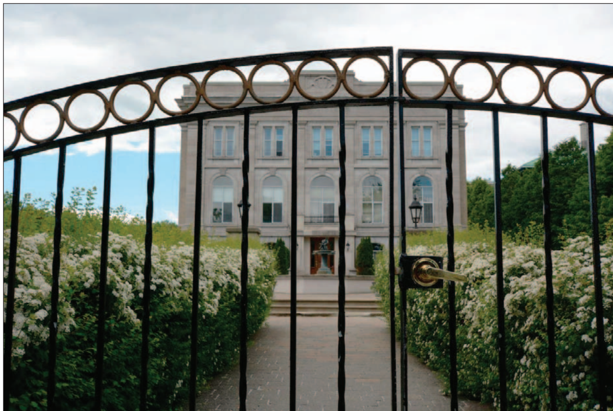
Difficile de se loger à Montréal? Pas pour tout le monde!