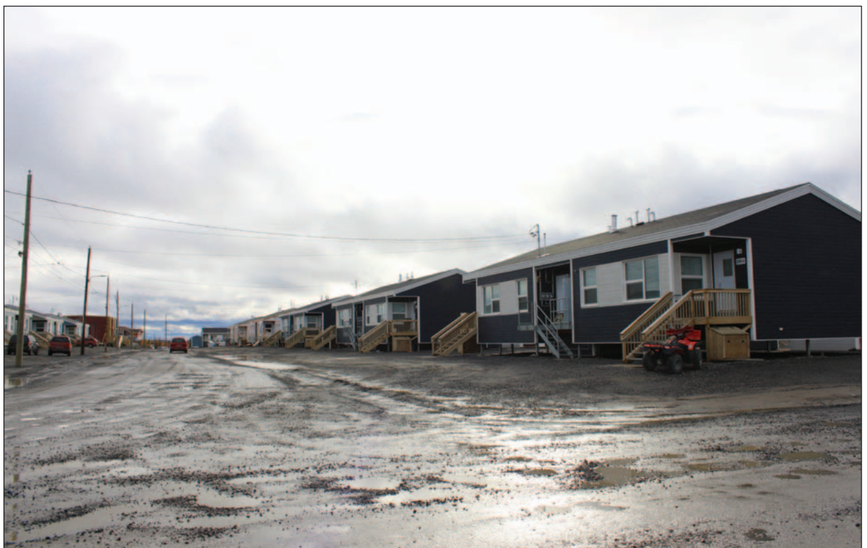
À Kuujuaq, au Nunavik.