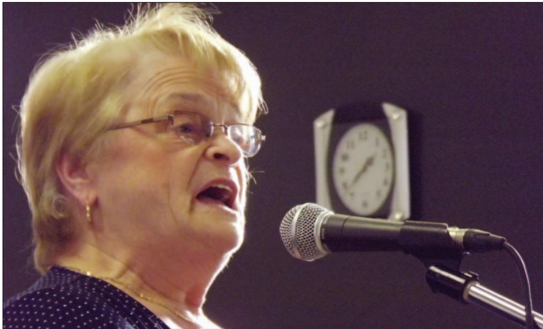
Une dame témoigne lors du passage de la Commission populaire itinérante sur le droit au logement à Lévis, à l'automne 2012.