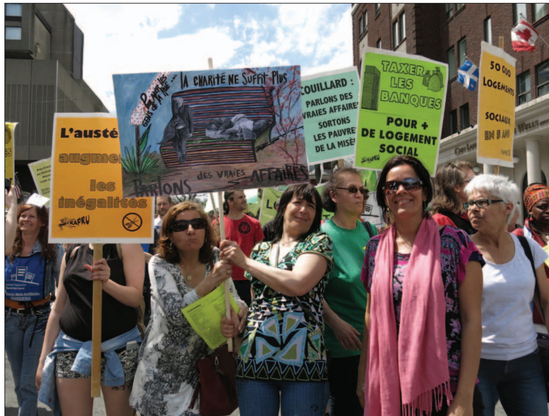
Le logement : un sujet de mobilisation pour bien des femmes.

Les difficultés économiques ne représentent qu'un aspect de la réalité des femmes locataires. La discrimination lors de la recherche d'un logement en fait aussi partie, surtout pour les mères de familles, les femmes immigrantes ou celles à l'aide sociale. L'intimidation, le harcèlement et même le harcèlement