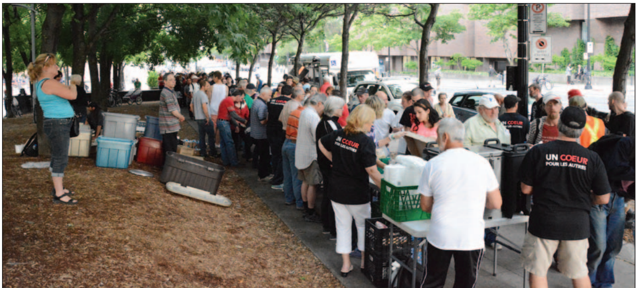
Fréquenter les soupes populaires est le lot de bien des personnes seules.